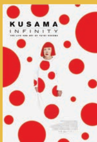
草間彌生 INFINITY 監督：ヘザー・レンズ アメリカ | 2018年 | 76分