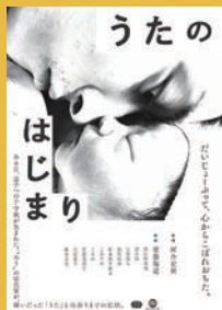
うたのはじまり 監督：河合宏樹 日本 | 2020年 | 86分