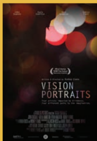
Vision Portraits 監督：ロドニー・エヴァンス カナダ・ドイツ・アメリカ 2019年 | 78分