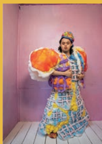
対話する衣服 監督：河合宏樹 日本 | 2021年 | 90分