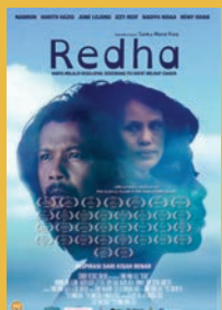
Redha 監督：トゥック・モナ・リザ マレーシア | 2016年 | 115分