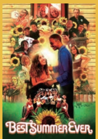
Best Summer Ever 監督：マイケル・パークス・ランド、ローレン・スミテリ アメリカ | 2020年 | 80分

※上映作品の視聴方法や追加作品は決定次第、公式サイトやSNSなどで発表致します。 https://truecolorsfestival.com/jp/program/true-colors-film-festival-2021/